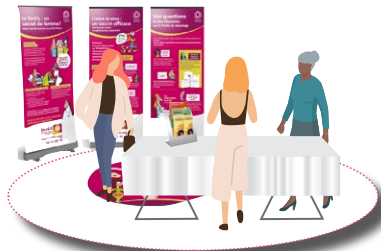
Stand dépistage cancer du col de l'utérus