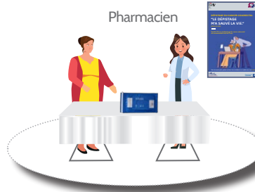
Remise d'un test de dépistage du cancer colorectal